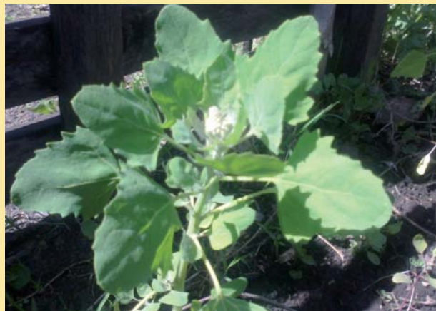
En la fotografía planta de Quínoa