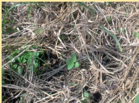
En la Fotografía plántulas de resiembra natural de Chía. Se realizaron además transplantes de Quínoa. Estas plantas se obtuvieron de semillas compradas cultivadas procedentes del Campo Experimental de Moreno.

Este curso es dictado por los Ing. Agr. Guillermo Núñez y Eduardo Merluzzi. Durante el mes de octubre se desarrollarán los miércoles de 12 a 14 los cursos de Plagas y Enfermedades de las Plantas. Los interesados pueden inscribirse personalmente en Arieta 2400, San Justo, de lunes a viernes de 9 a 12.