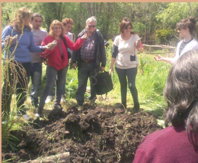
Los alumnos del segundo curso de Huerta Orgánica, durante la preparación de un almácigo de batata