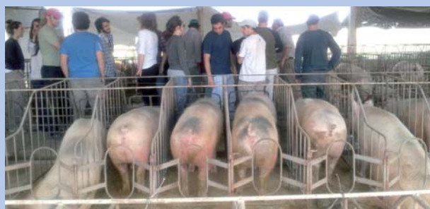
Recorriendo criadero de cerdos