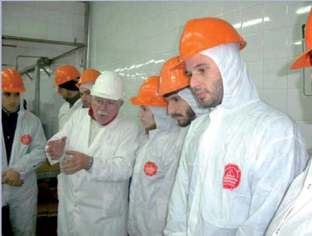
Los alumnos en diferentes momentos de la recorrida