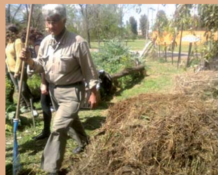
Alumnos del curso de compostaje durante el proceso de armado de pilas