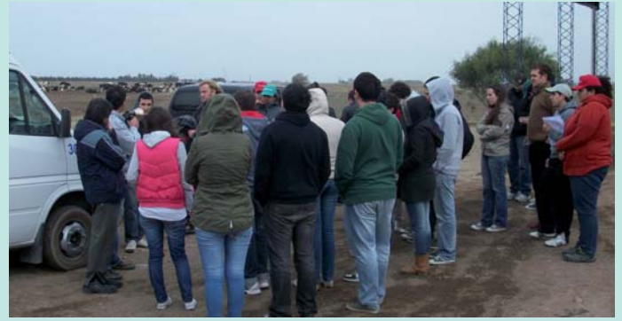
En un Feedlot