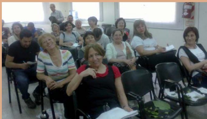
En la Fotografía se puede observar parte de los alumnos que asisten al mismo.

En octubre se inició con muy buena asistencia de alumnos el Curso de Plagas y Enfermedades en el Centro Demostrativo de San Justo. Dicho curso se desarrolla en cuatro clases y es teórico práctico.