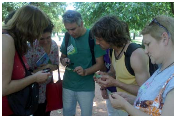
En la fotografía se puede observar a algunos de los alumnos realizando tareas de reconocimiento de insectos en el espacio didáctico del Parque Avellaneda.

En el mes de octubre comenzó el curso de Plagas y su control en el Parque Avellaneda. Este curso se lleva adelante durante cuatro clases. Durante el mismo los alumnos realizan reconocimiento de diferentes especies y buscan identificar problemas que se les presentan en sus actividades productivas.