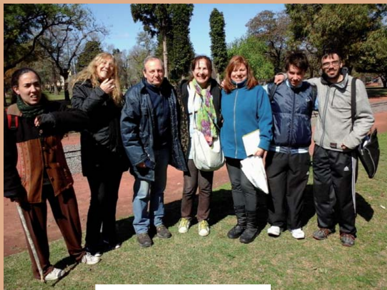
Vista de algunos de los participantes