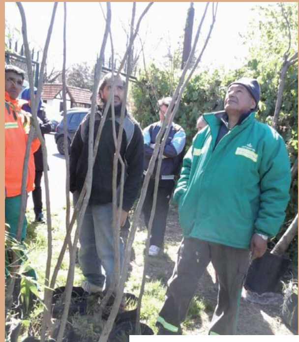
En el espacio didáctico con los árboles