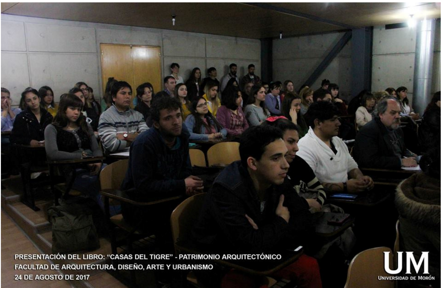
PRESENTACIÓN DEL LIBRO: "CASAS DEL TIGRE" - PATRIMONIO ARQUITECTÓNICO FACULTAD DE ARQUITECTURA, DISEÑO, ARTE Y URBANISMO 24 DE AGOSTO DE 2017