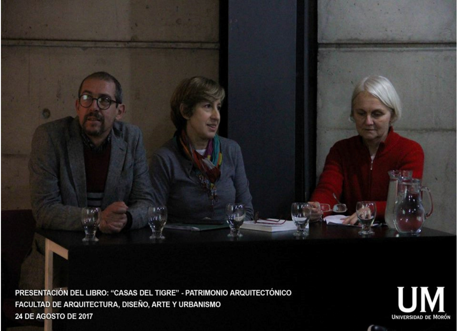
PRESENTACIÓN DEL LIBRO: "CASAS DEL TIGRE" - PATRIMONIO ARQUITECTÓNICO FACULTAD DE ARQUITECTURA, DISEÑO, ARTE Y URBANISMO 24 DE AGOSTO DE 2017