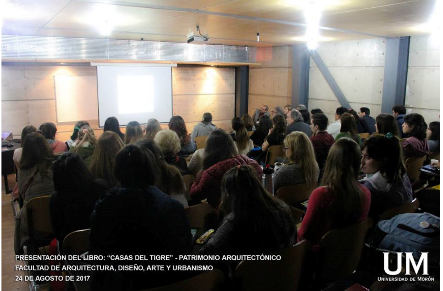
PRESENTACIÓN DEL LIBRO: "CASAS DEL TIGRE" - PATRIMONIO ARQUITECTÓNICO FACULTAD DE ARQUITECTURA, DISEÑO, ARTE Y URBANISMO 24 DE AGOSTO DE 2017